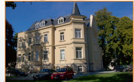
RPK Reha Z Glauchau