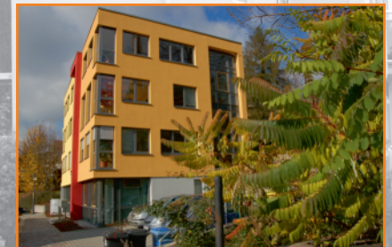
Tagespsychiatrie Außenstelle Limbach-Oberfrohna